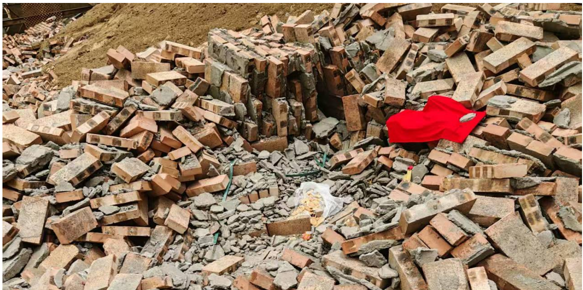
死者位置（中部坑内）

死者位置位于三角形平台北侧红砖围墙2.4m处，距西侧固定设备墙3.5m，头东脚西斜躺着，脸部朝北，头部、腿上出血。