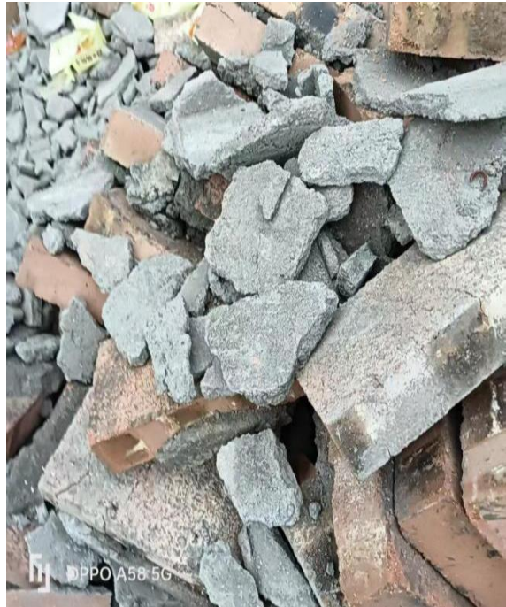
砂浆面与红砖多处分离