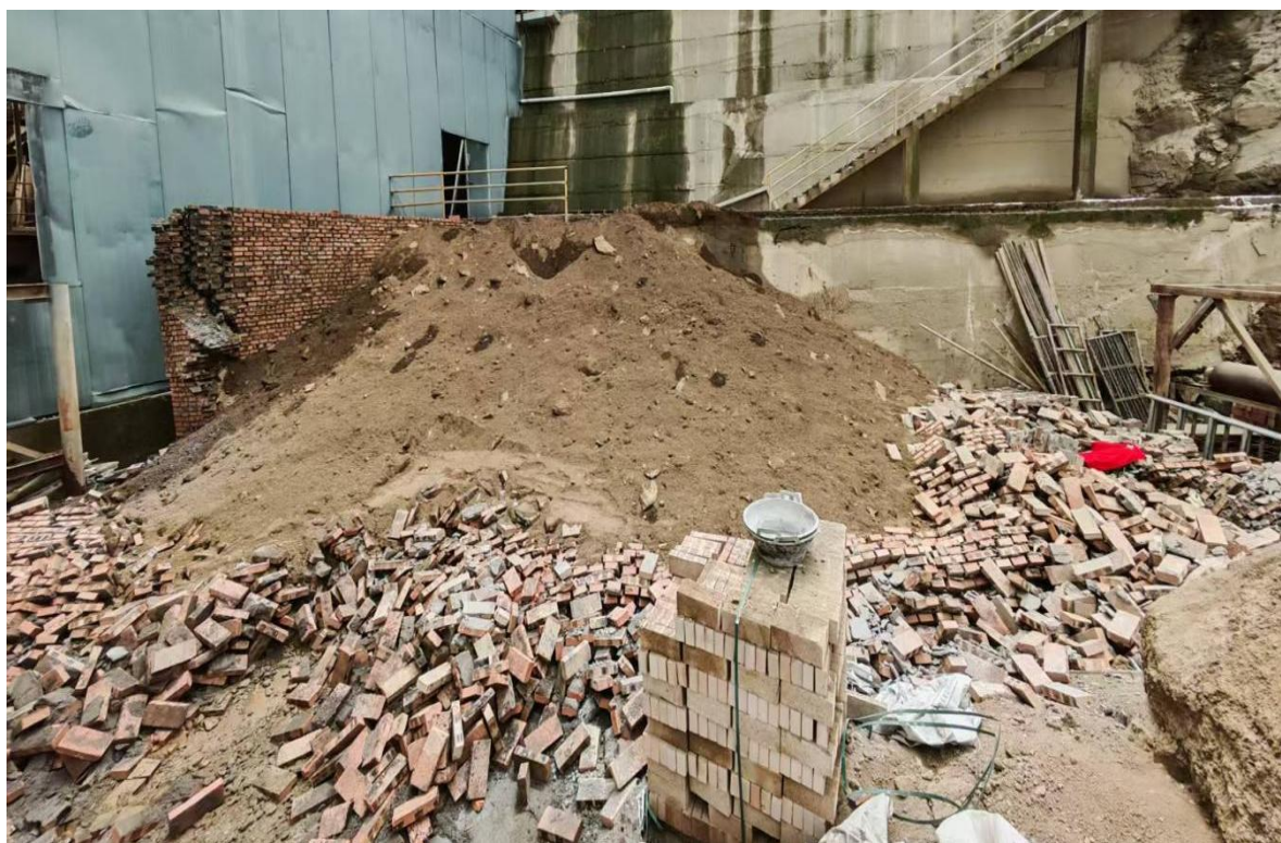
平台北侧红砖围墙坍塌现场

事发红砖围墙位于成品库南侧，平台北侧红砖围墙整体向北侧坍塌，红砖围墙未做基础，直接砌在厂房内的水泥地面上。平台东侧围墙仍残存，长度5m、高3m、厚0.49m，两墙拐角连接处呈撕裂状，未见拉结钢筋，砂浆面与红砖多处分离。砂土覆盖在坍塌的围墙上。