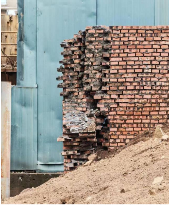
残存的东侧红砖围墙