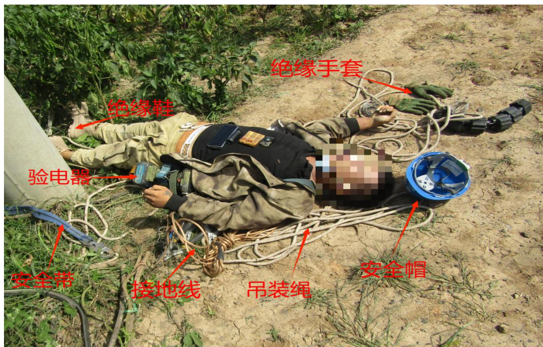
安全带、验电器、接地线、吊装绳、安全帽、绝缘鞋